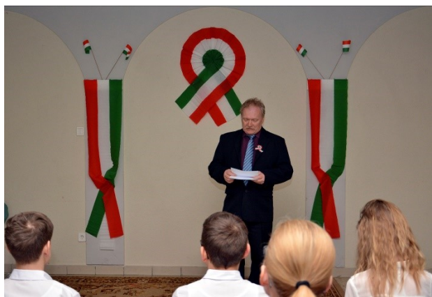
Archív: 2018. évi megemlékezés a Faluházban

Március 15-én reggel Petőfi Sándor, Vasvári Pál, Jókai Mór és Bulyovszky Gyula megváltoztatta a Diétához* intézett tizenkét pont bevezetését, és politikai fellépésüket indokoló kiáltványt fogalmazott meg. A pontok szövegét a politikai röplap műfajához igazították, két pontot összevontak, és a szövegbe bekerült a politikai foglyok szabadon bocsátásának követelése. Ezt a kiáltványt olvasták fel a Pilvax kávéházban gyülekező ifjaknak, majd Petőfi elszavalta két nappal korábban írott, a március 19-i reformlakomára szánt költeményét, a Nemzeti dalt. Ezután