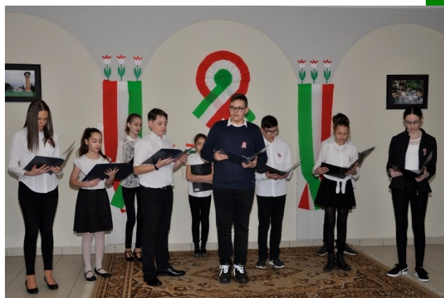
Archív: 2018. évi megemlékezés és emlékműsor a Faluházban