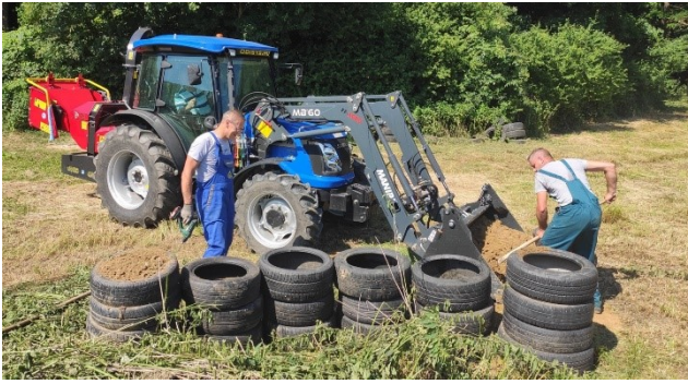
Társadalmi munka a pályán