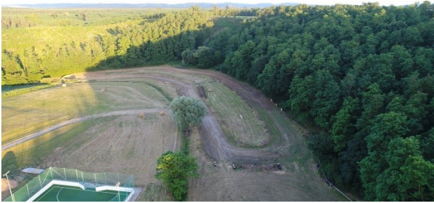
A versenyre előkészített pálya