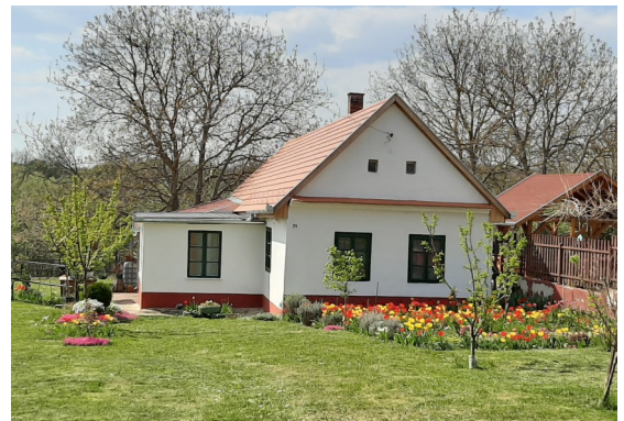
Április hónap szépen gondozott, "Rendezett a környezetem" címre jogosult Petőfi Sándor utca végi takaros porta

Nagypáli Község Önkormányzata eddig minden évben pályázatot hirdetett a „ Rendezett a környezetem ” elismerő cím elnyerésére, melyet legfeljebb egy pályázó nyerhetett esztétikusan a környezetéhez illeszkedő kertjével. Ez év áprilisától a település vezetősége havonta választja ki a takaros portákat, melyek képe elismerésül kiemelésre kerül honlapunkon.