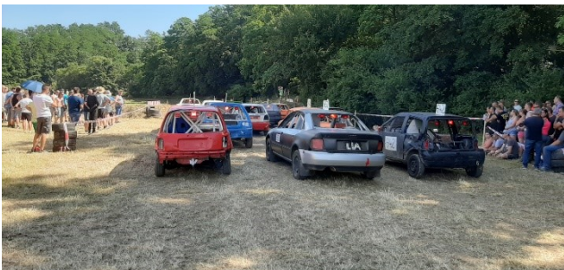
Versenyzők a startvonalon

A szezon első roncsderbi bajnoki futamát július elején rendezték meg a faluban, Napkitörés Derby néven.