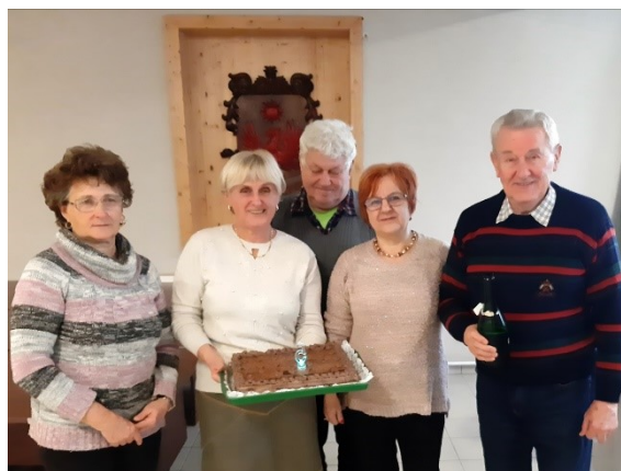
Régi-új vezetőség a születési tortával