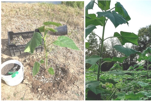
Ültetési kori smaradfa