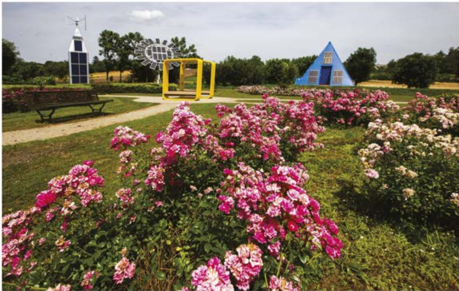
Nyár az Energiaparkban