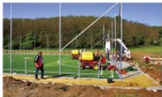
Építkezések, fejlesztések: bal oldalon: Integrált közösségi Szolgáltató tér, Főnix Szolgáltató Központ. Jobb oldalon: Energia Park, Mátyás Király utca, Arany János utca