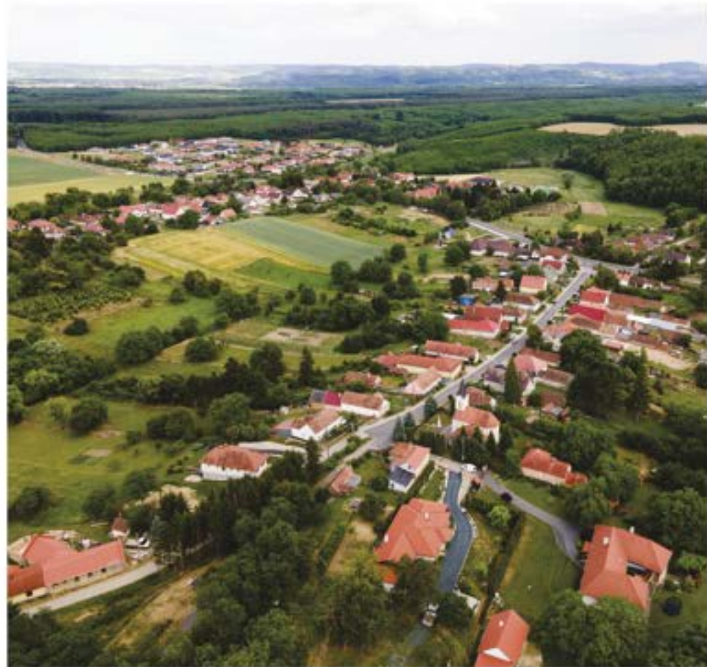
Arany János utca madártávlatból