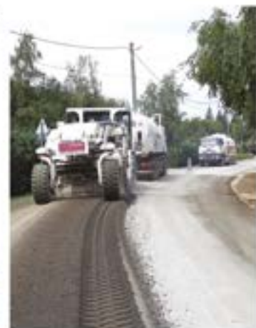
Építkezések, fejlesztések: bal oldalon: Mátyás Király utca, hegyi út szélesítése, faluközpont, jobb oldalon: Ady Endre utca, mezőgazdasági út, Arany János utca.