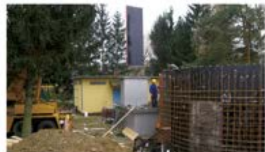
Építkezések, fejlesztések: Türapark kialakítása, napelemes borozótető, kemence építés.