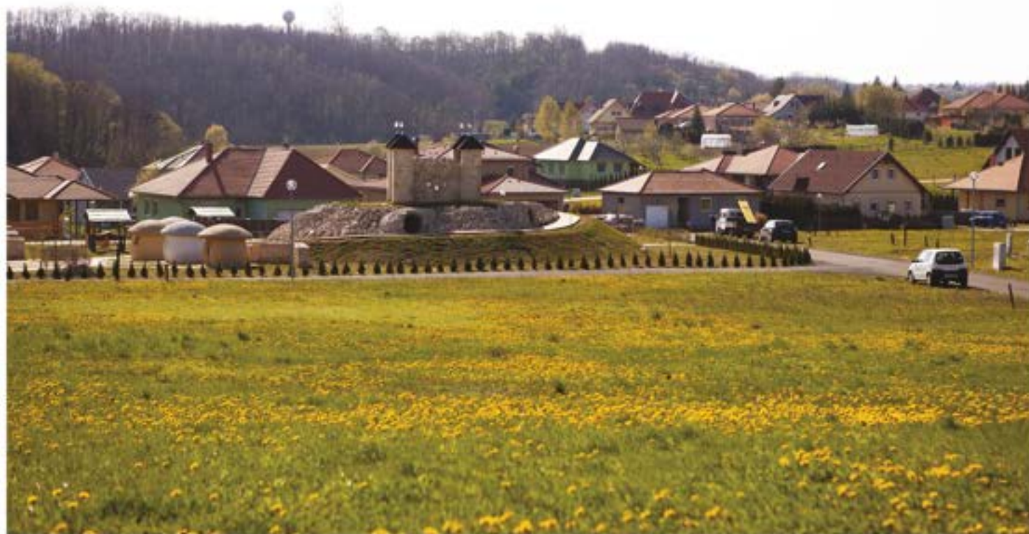
Tavaszi a lakótelepen