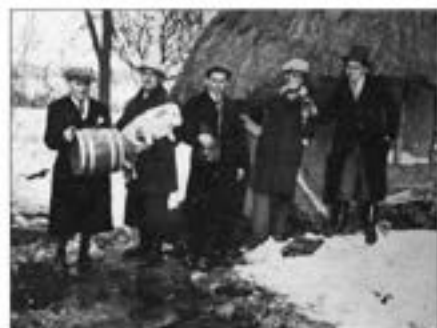
Válogatás a Zalai Hírlap cikkeiből

ez sem késik sokáig. A tervenet megvalósításá- hoz természetesen szükséges az Országos Műemléki Felügyelőség, vala- mint a tanács szervek támo- gatására lenne szükség. Re- méljük — ismerve a javasol- tak fontosságát, sürgősségét — ez sem késik sokáig.