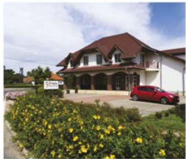
Önkormányzati épület és Energiapark