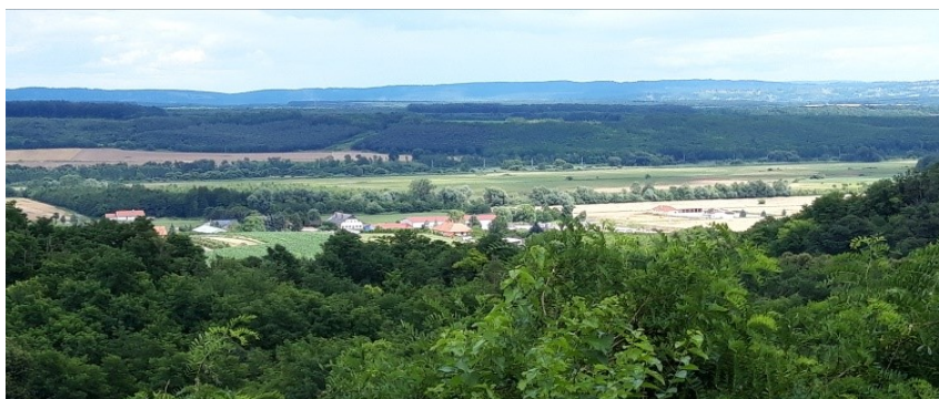
Látkép a Csippánhegyről

Egyre többen kíváncsiak Nagypáli eredményeire, ezért kiemelten fontos, hogy az idelátogatóknak mindenféle szín-pompás, esztétikus látványban legyen részük. A település közttereinek rendezettsége az idén is nagy hangsúly ka-pott a közmunkák szervezésénél. Ugyanakkor a szép látvány nem csak a falu lakóterületére korlátozódik, de gyö-nyörű kilátás nyílik a pincék környékéről is, ahonnan akár 30-35 km-re is ellátni jó időben.