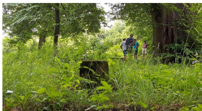
Vereckei katonai temető napjainkban

közös nemzetközi pályázati együttműködés feladatai voltak napirenden. Vereckén a háborús katonai temető rehabilitációjához kapcsolódó pályázati dokumentációkhoz szükséges kiegészítések elvégzése és költségvetés összeállítása volt a feladat. Mindezeket a dokumentumokat a bonyolító alapítvány felé is meg kellett küldeni.