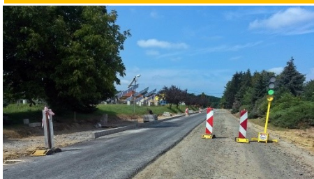
A járda kialakítása az út mellett.

Magyar Közút Nonprofit Zrt. állami útkezelő beruházásában ütemesen folytatódik a 74-es