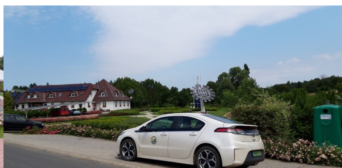
Virágok díszítik a rendezett faluközpontot