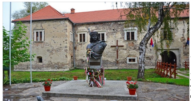
Rákóczi-várkastély a szlovákiai Borsiban

A látogatás során küldöttségünk ellátogatott a szlovákiai Borsi település Rákóczi-várkastélyához ahol ebben az évben a magyar kormány támogatásával nagyobb szabású felújítási munka fog elkezdődni. Elképzelésünk szerint, az önkormányzatunk szervezésében egy kisebb küldöttségünk társadalmi-, közösségépítő munkával venne részt ebben a felújításban.