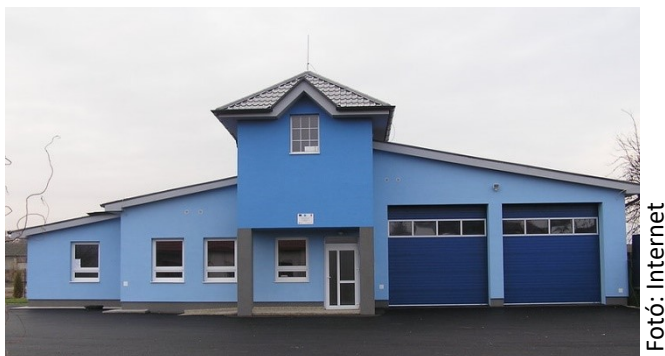
Tűzoltó laktanya Bodrogszerdahelyen

A megbeszélés során a civil szervezetek együttműködéséről - ezen belül is a tűzoltó egyesületek szakmai képzésének lehetőségéről - is tárgyaltak. Várhatóan ősszel kerülne sor a két egyesület közötti találkozóra, melynek helyszíne (Nagypáli vagy Bodrogszerdahely) még nem eldöntött.