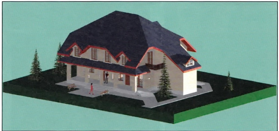
Archív látványterv: Fecskeház

Nagypáli Önkormányzata nem mondott le arról a régóta meglévő tervéről, hogy a falu lélekszámának gyarapodását ne csak az újonnan letelepülő családok jelentsék, hanem az itt felnövő fiataloknak, fiatal családoknak a faluban történő letelepedésével is növelje a közösséget.