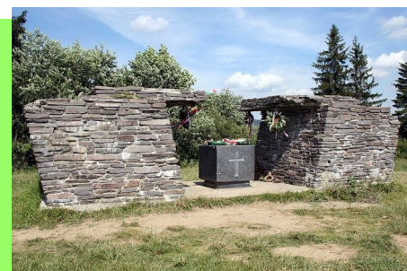
Emlékhely a Vereckei-hágónál

A mintegy 2500 fős lakosú ruszin falu Alsóverecke városi jellegű település Ukrajna Kárpátaljai te-